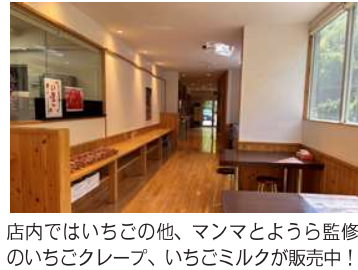
店内ではいちごの他、マンマとよら監修のいちごクレープ、いちごミルクが販売中!

新生すいしゃは、ふるさと納税返礼品出荷の拠点として展開中だ。3月末時点で112件、寄付額合計104万8千円の実績を積んでいる。また地場産物販売加工施設としても稼働中。現在3事業者が水産加工品開発へ向けて精力的に活用している。