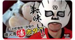
北海道豊浦町 ふるさと豊浦特産CM【ホタテマスク漁に出る】