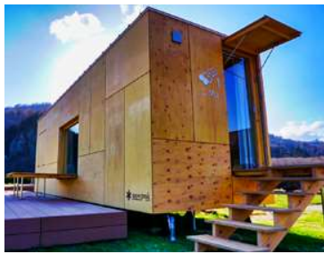
礼文華海浜公園のトレーラーハウス。あの建築家・隈研吾氏と snow peak 社のコラボレーション施設だ。お問合せは観光協会へ。

国籍別 内 訳 日本 29組 1,117名、シンガポール 26組 153名、アメリカ 10組 70名、フィリピン 5組 42名、カナダ 3組 9名、マレーシア 2組 4名、台湾他 1組 12名、欧米豪（団体） 3組 40名