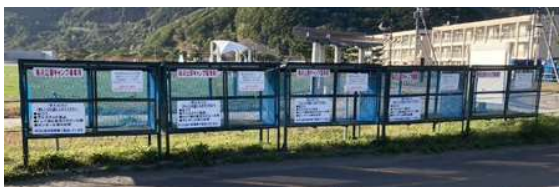
ゴミのお持ち帰り前提ではどうしても汚れてしまう...そこでコレを設置！今ではゴミも放置されず、近隣住民の苦情も減少した。

「ゴミの収集を始めたら長年の課題であった「放置ゴミ」の撲滅にむけ、昨年よりゴミステーションの設置を開始している。効果はまさにテキメン、利用者の方も「便利になった」と好評だ。