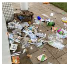
放置されたゴミ。以前はこれが当たり前になっていた...

昨年開催され、見に来た町民の どきも 度肝を抜いたあの「SUP(サップ)フェス」が、好評を受け今年も開催される予定だ。SUPとはスタンドアップパドルボードの略で、近年人気上昇中のマリンスポーツ。海浜公園で繰り広げられるパドラー達のカッコよさは一見の価値あり。続報を待って欲しい。